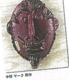
宇野 マーク 剛啓